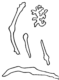
Рис. 12. Peristichopus papillatus gen. et sp. n. Спикулы из папиллы.